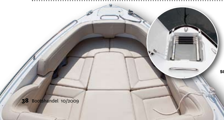
Das Vorschiff lässt sich zur Liegeland-schaft umbauen