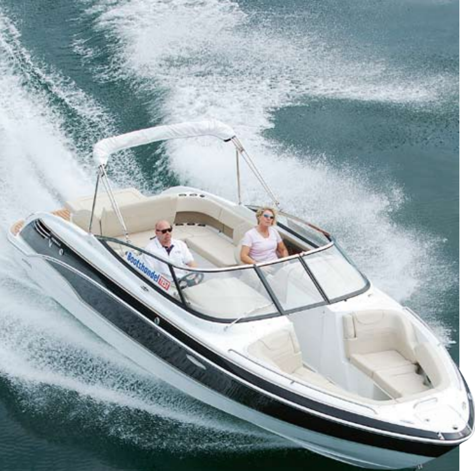
unten: Kraft und Komfort bietet die Formula gleichermaßen; sogar eine kleine WC-Kabine gibt es an Bord