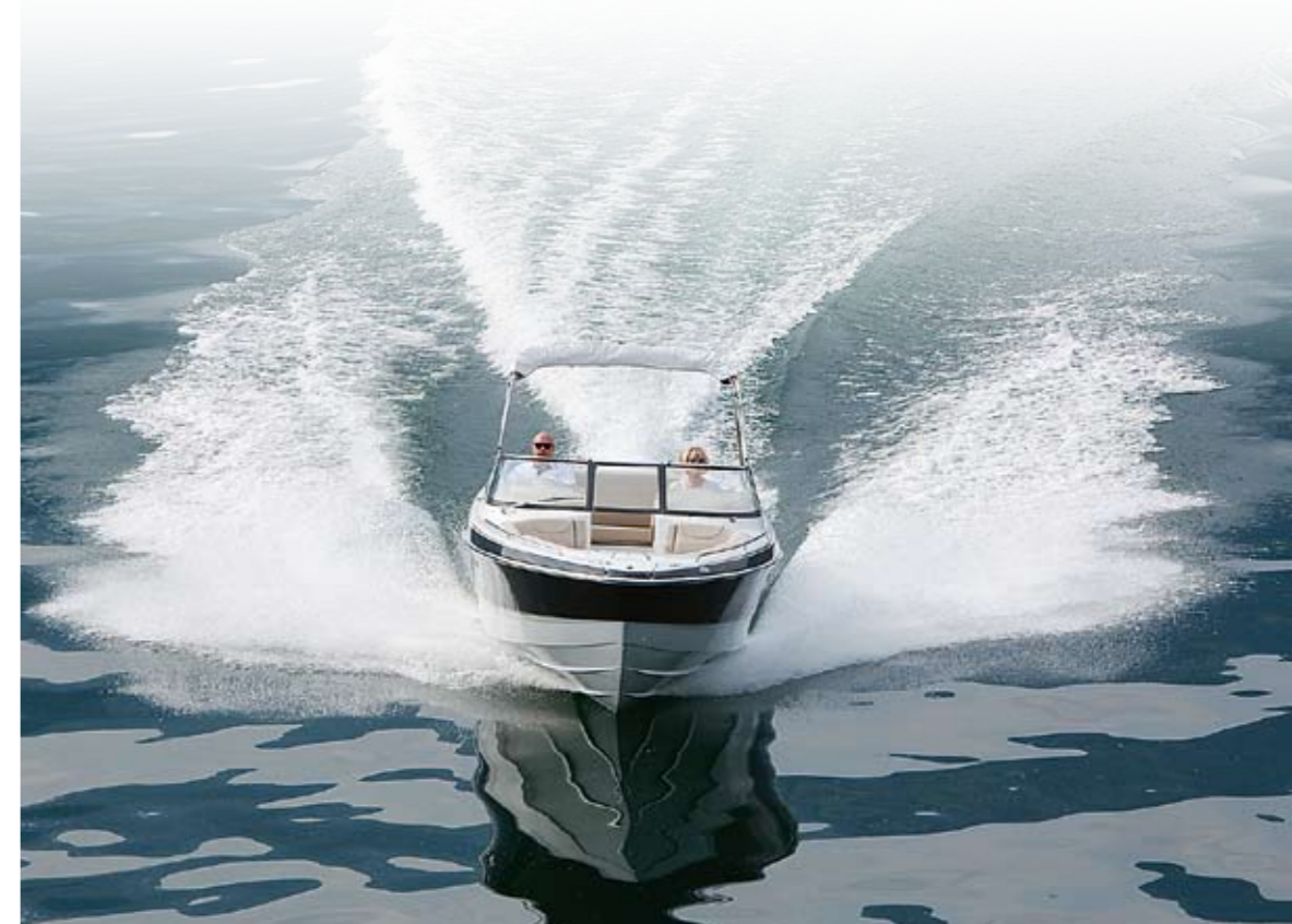
Der tief gezogene V-Rumpf zeichnet fast alle Boote des US-Herstellers aus

Das glatte Wasser des Sees im sommerlichen Tessin ist ein idealer Testparcours, fast wie ein Heimatrevier für das schnelle US-Boot. Der für neun Personen zugelassene Bowrider macht Spaß und überzeugt durch angenehme, seidige Laufeigenschaften.