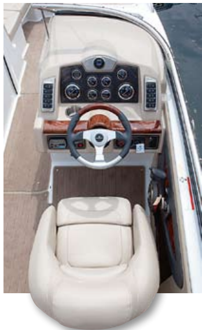
Das Allerheiligste: die Pilotenkanzel der 270 BR

Optisch dominant wirkt die Sonnenliege oberhalb des Motorenabteils. An deren Backbordseite ist ein Staukasten für Fender, Leinen und alles andere, was man sonst an Bord in Gebrauch hat. Rechts von der Liege befindet sich – ebenfalls mit pflegeleichtem Kunstteak ausgelegt – der Durchgang zum 2,30 m langen und zwei Meter breiten Cockpit, das komplett mit einem hellen, gegen Wasser unempfindlichen Teppich von der Optionsliste ausgelegt ist.