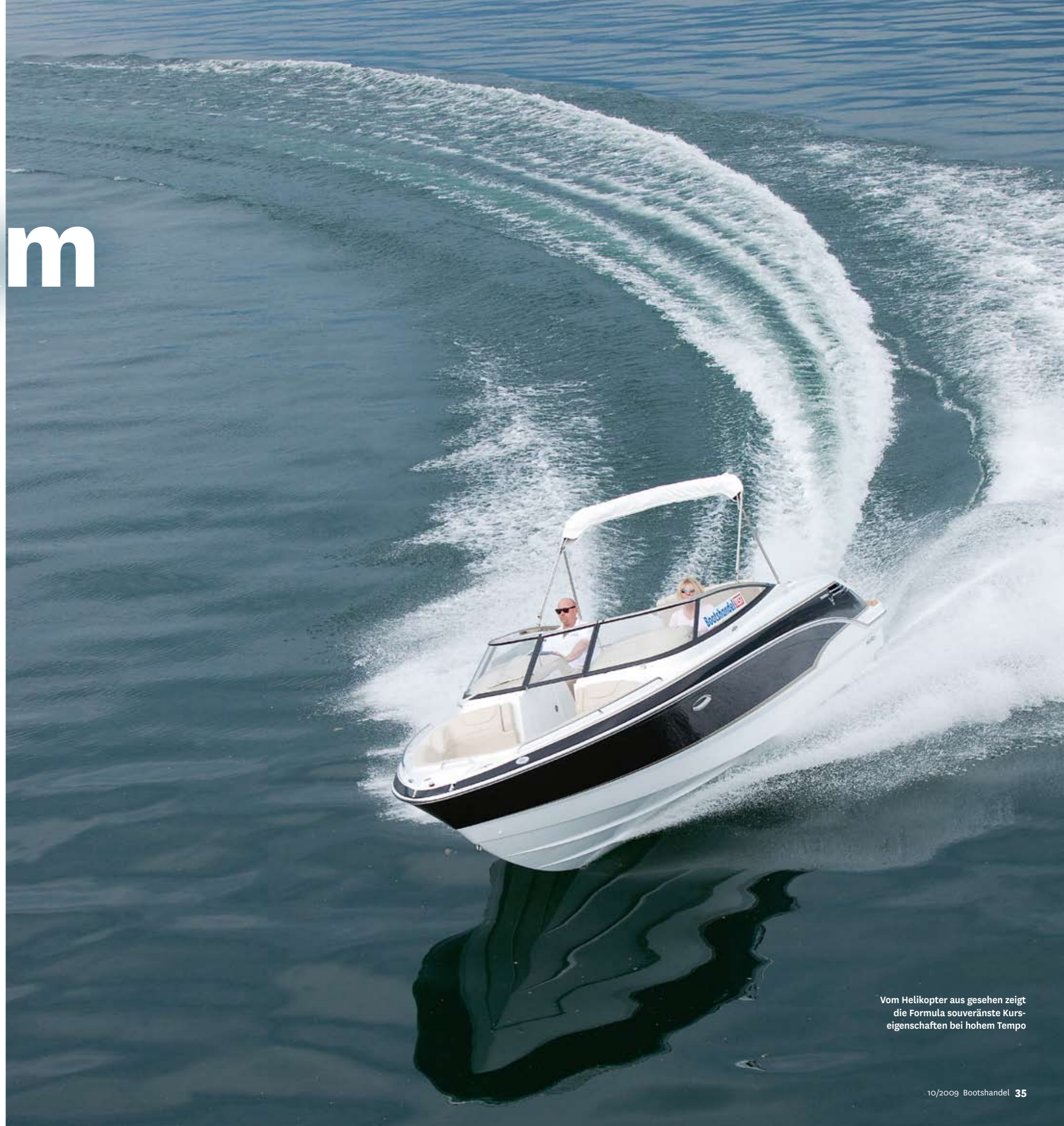
Vom Helikopter aus gesehen zeigt die Formula souveränste Kurseigenschaften bei hohem Tempo